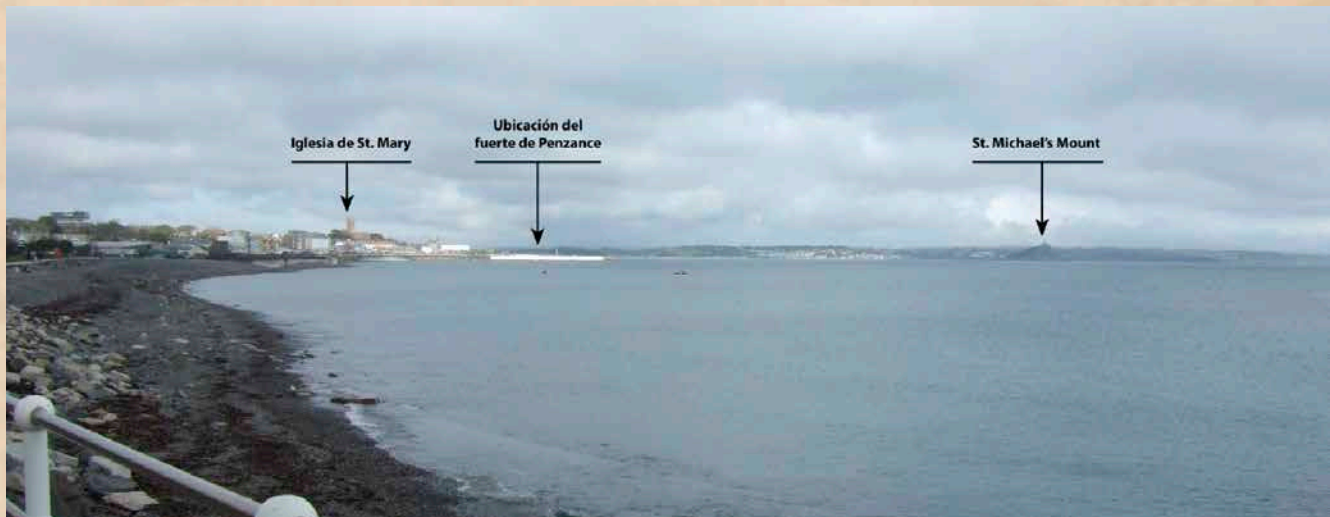
Área de desembarco de Penzance y puntos dominantes y críticos que encontraron las galeras españolas