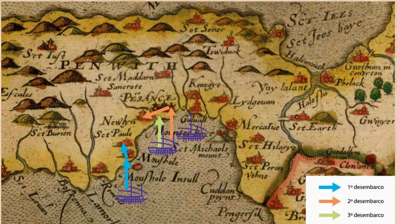
Bahía de Mount señalando los tres desembarcos efectuados por tercios y galeras (Mousehole y Penzance)