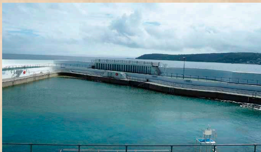
Punto de ubicación del fuerte y pieza artillera de Penzance. Al fondo, Newlyn