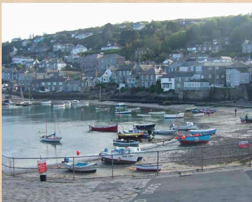
Puerto y núcleo urbano de Mousehole (2023)

a dicha multitud contra la que, tras recibir el alferez Juan de Urbea «algunos mosquetes» de su capitán y la orden de pasar «adelante a remeter», se dirigieron los infantes «muy en orden».⁶ A causa de tal movimiento táctico, «comenzaron los ingleses a huir por toda la vuelta de la villa de Pensans, y sin defenderla la dejaron», hasta quedar «al amparo de un castillo que se dice Mancafu, que está a una legua de esta villa».